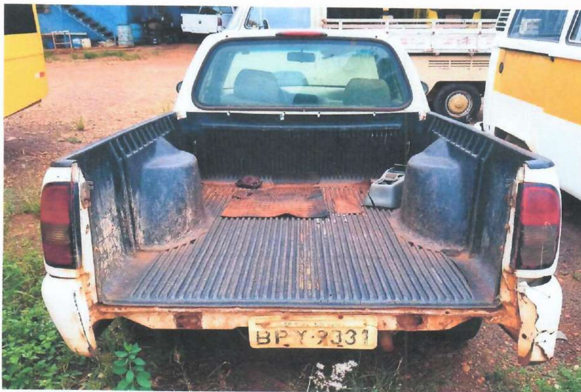
Lote 01- Picape Saveiro VW