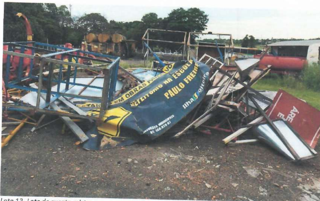
Lote 13- Lote de sucata mista