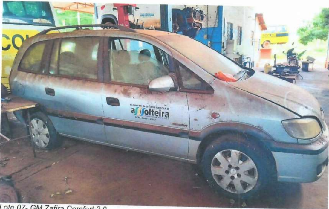
Lote 07- GM Zafira Comfort 2.0