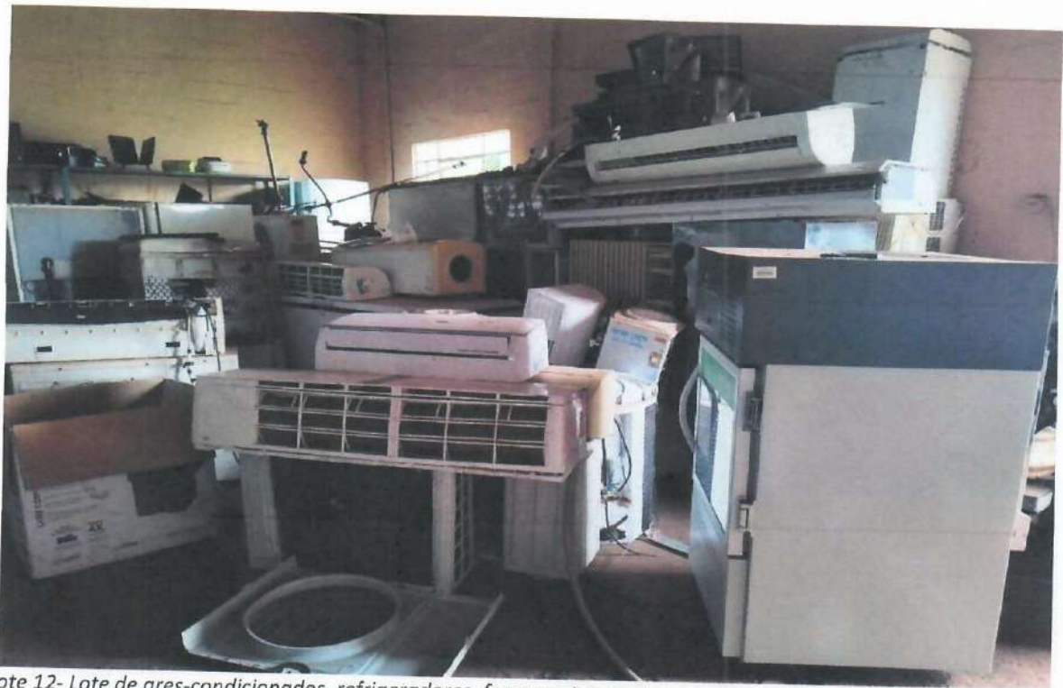
Lote 12- Lote de ares-condicionados, refrigeradores, ferramentas e outros.