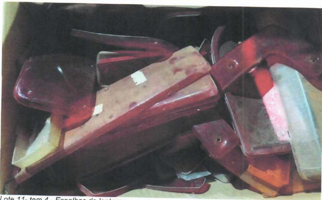
Lote 11- tem 4 - Espelhos de lanterna