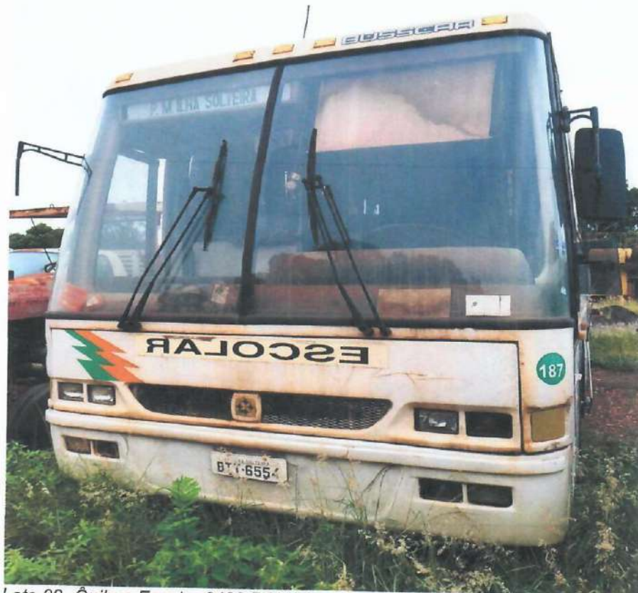
Lote 02- Ônibus Escolar 0400 RSE PL