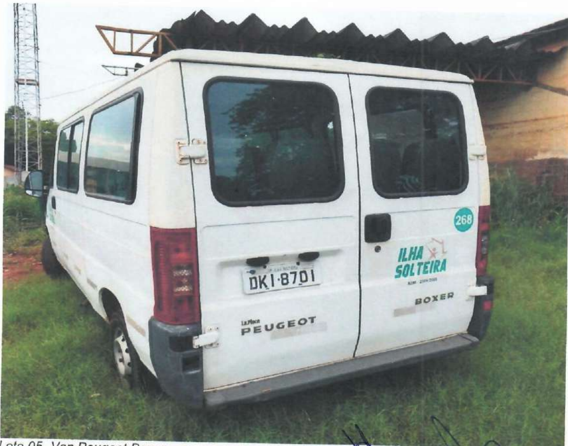
Lote 05- Van Peugeot Boxer

Handwritten signatures and marks are present at the bottom of the page.