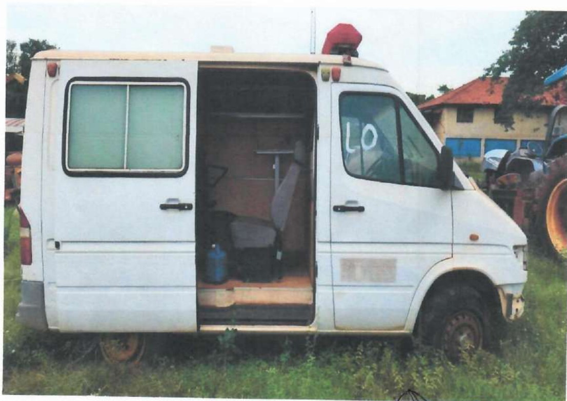
Lote 08- Item 2- Ambulância Mercedes Sprinter