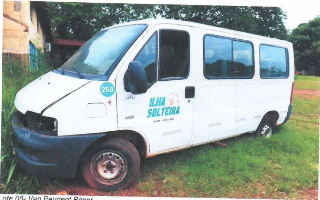
Lote 05- Van Peugeot Boxer