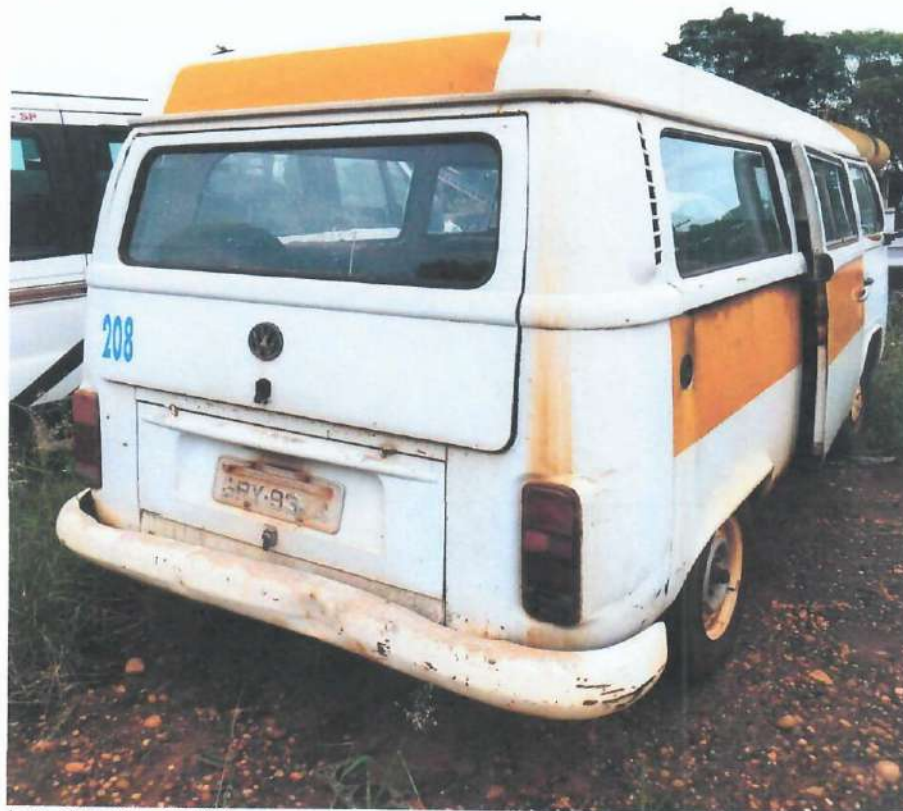
Lote 03- Kombi VW