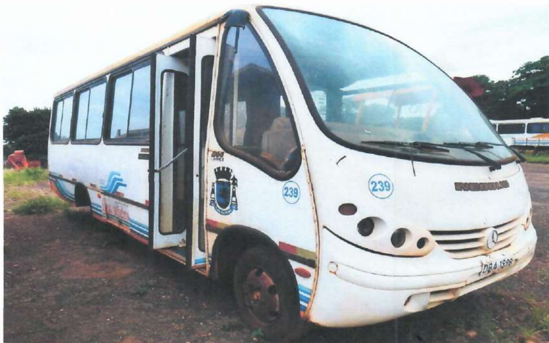
Lote 04- Micro-ônibus MBB Neobus Thunder LV