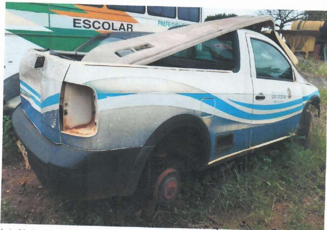
Lote 08- Item 1- Picape Saveiro CS