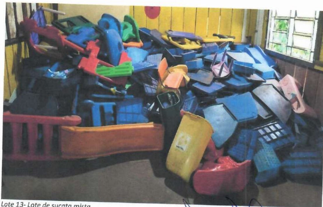
Lote 13- Lote de sucata mista