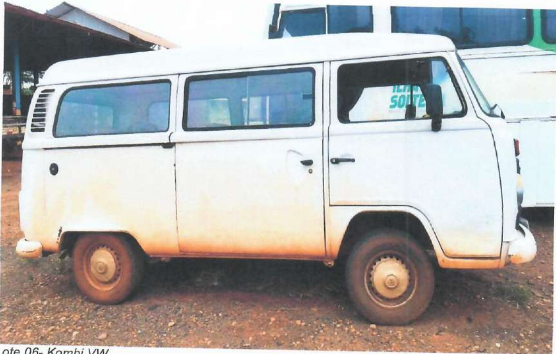
Lote 06- Kombi VW