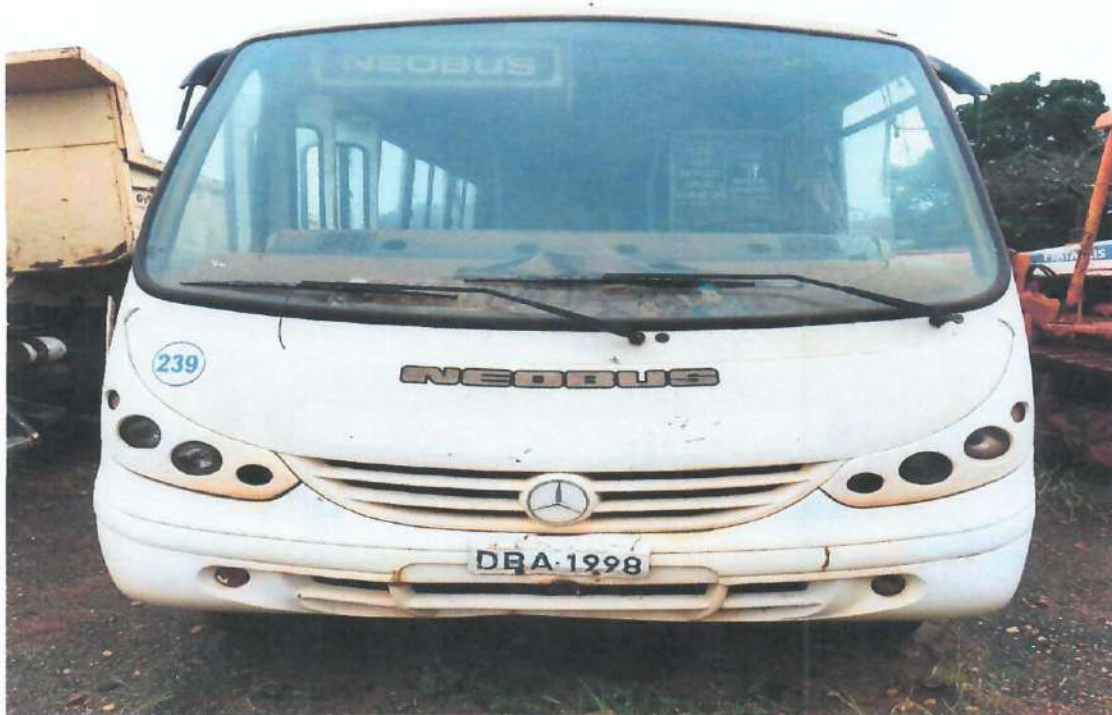
Lote 04- Micro-ônibus MBB Neobus Thunder LV