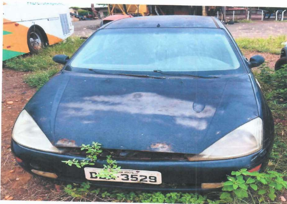
Lote 09- Ford Focus 2.0

Handwritten signatures and initials in the bottom left corner.