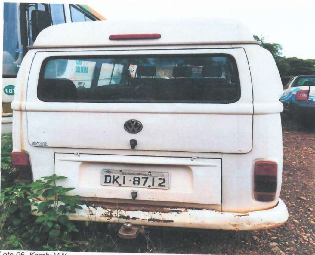
Lote 06- Kombi VW