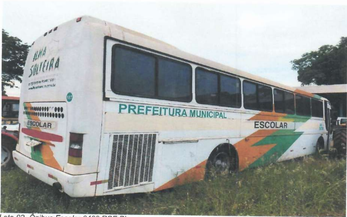
Lote 02- Ônibus Escolar 0400 RSE PL