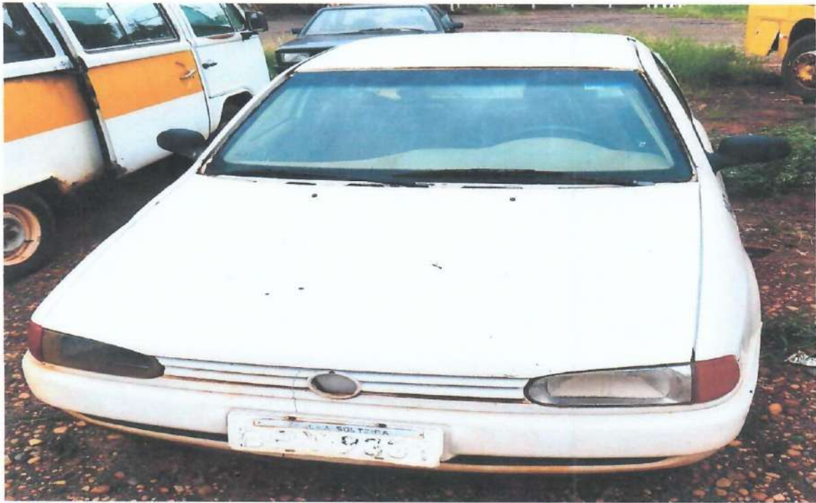
Lote 01- Picape Saveiro VW