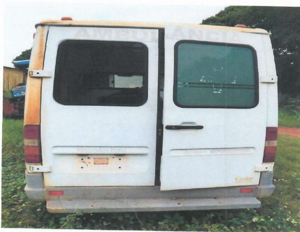
Lote 08- Item 2- Ambulância Mercedes Sprinter

Handwritten signatures and initials in blue ink.