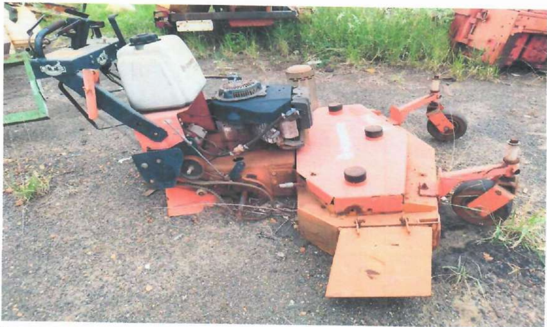
Lote 08- Item 3- Cortador de Grama Giro Zero Husqvarn