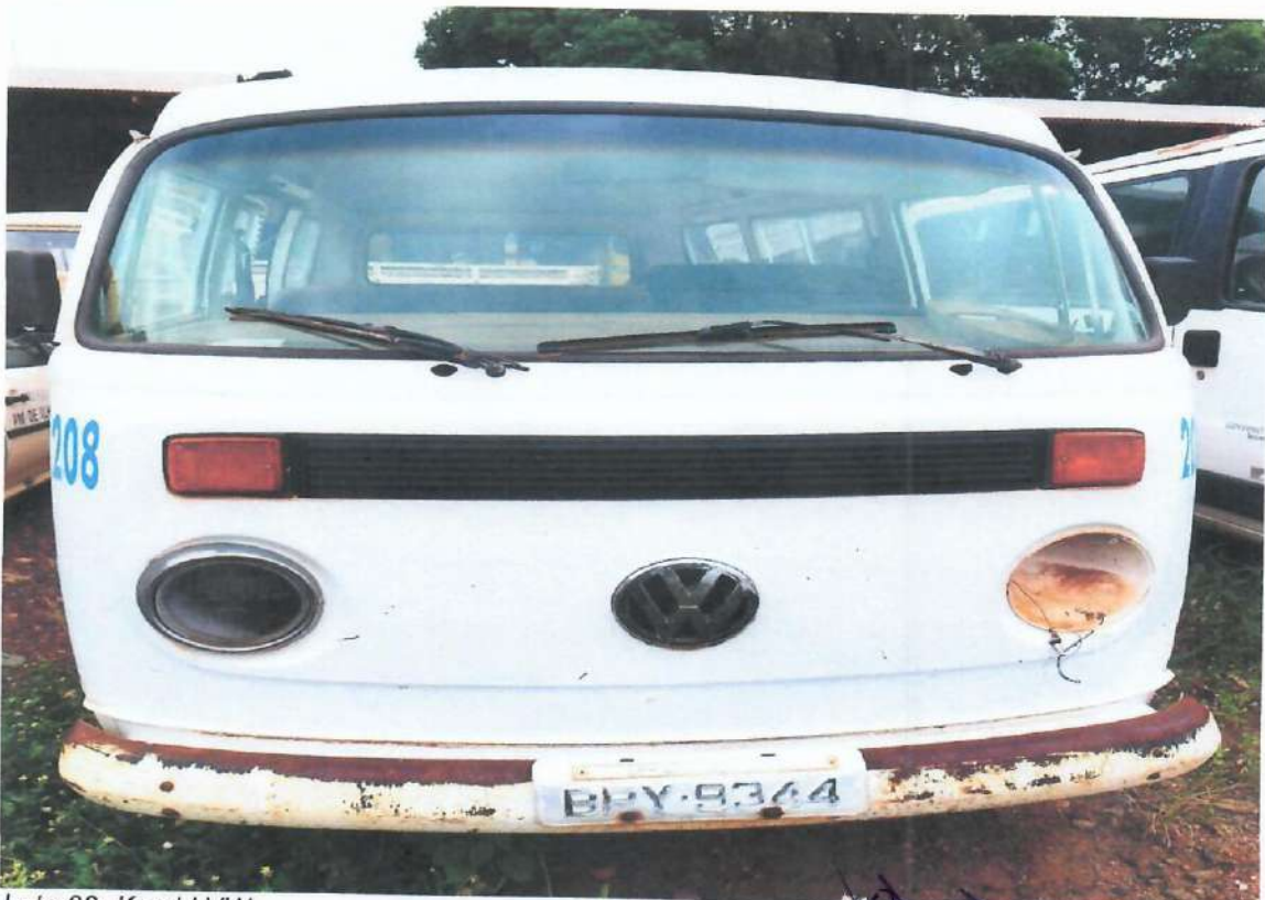
Lote 03- Kombi VW