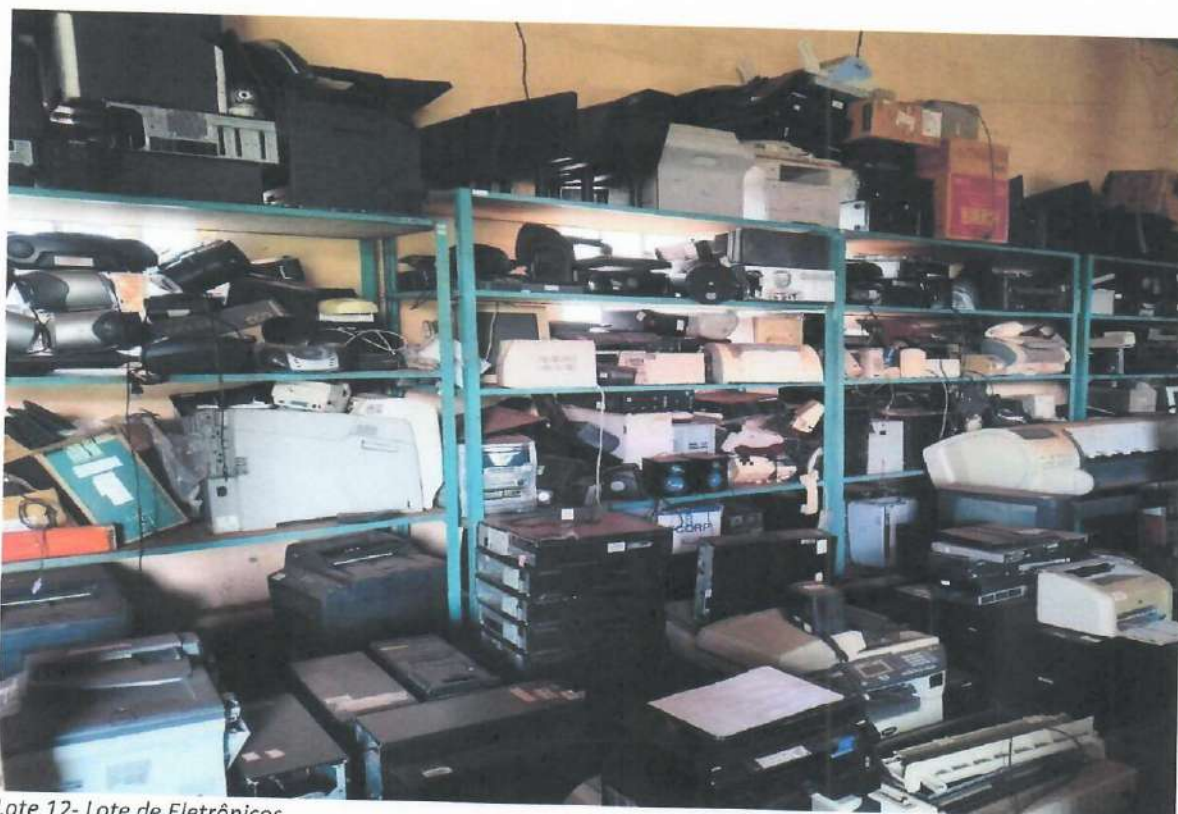
Lote 12- Lote de Eletrônicos