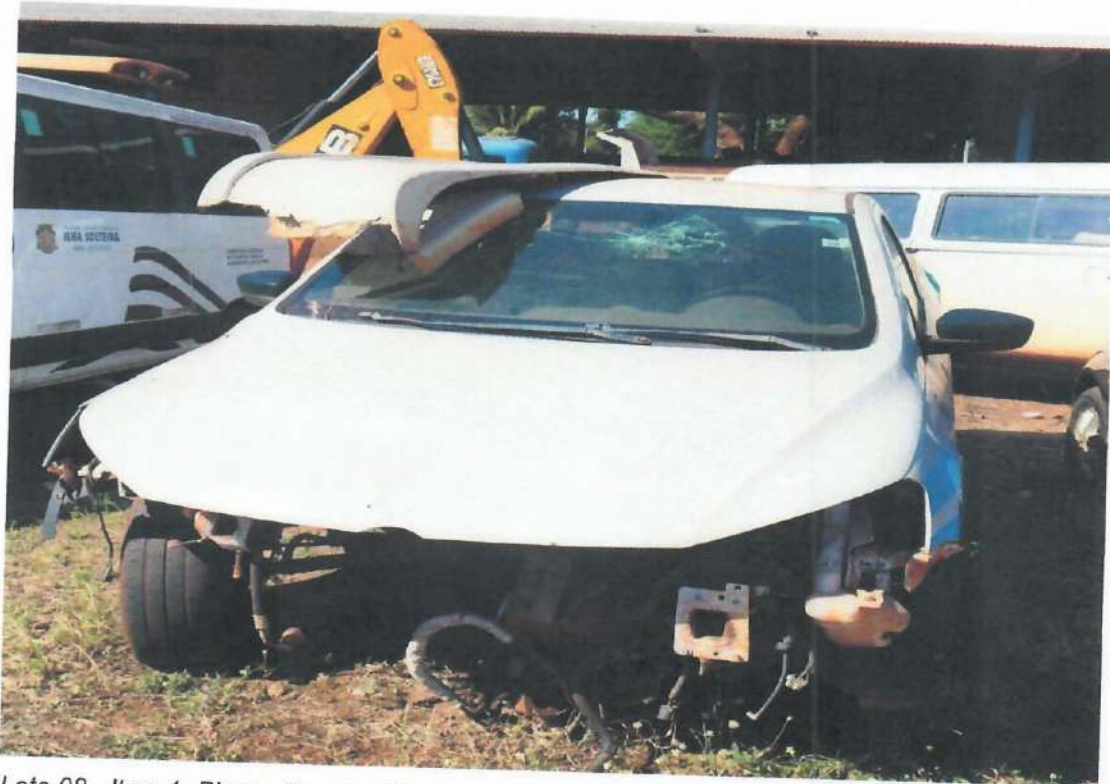
Lote 08 - Item 1- Picape Saveiro CS