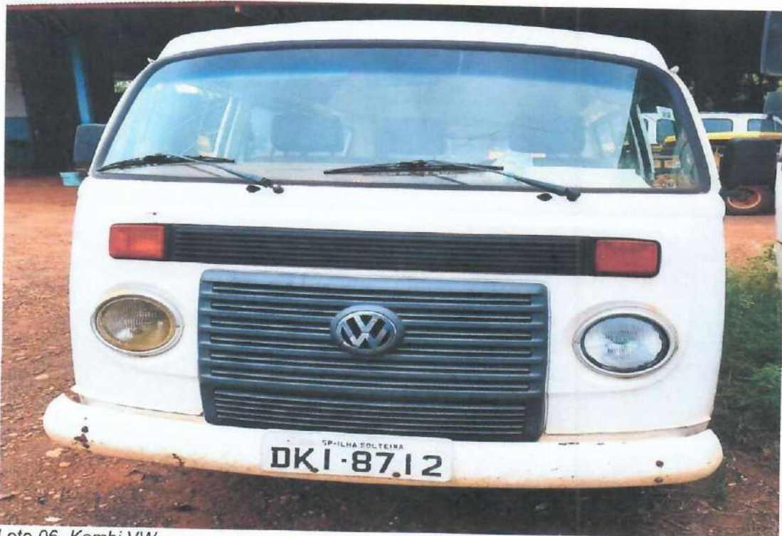
Lote 06- Kombi VW