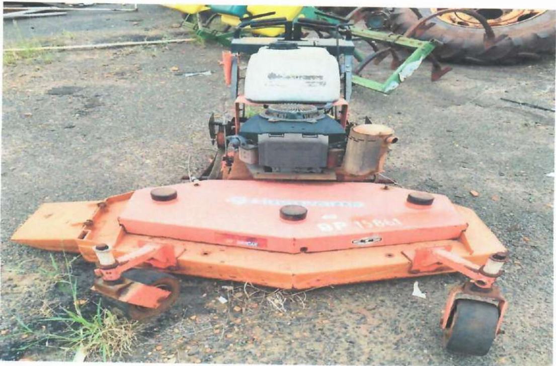
Lote 08- Item 3- Cortador de Grama Giro Zero Husqvarn