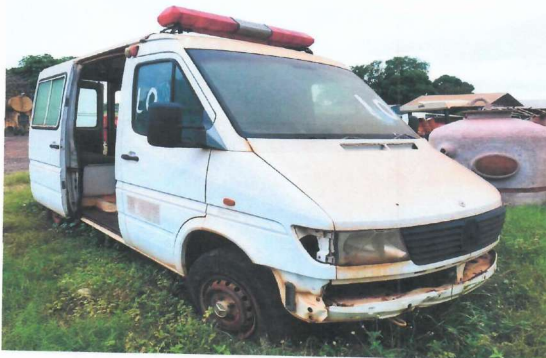
Lote 08- Item 2- Ambulância Mercedes Sprinter