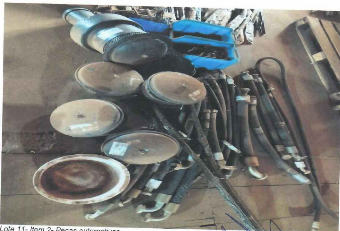
Lote 11- Item 2- Peças automotivas