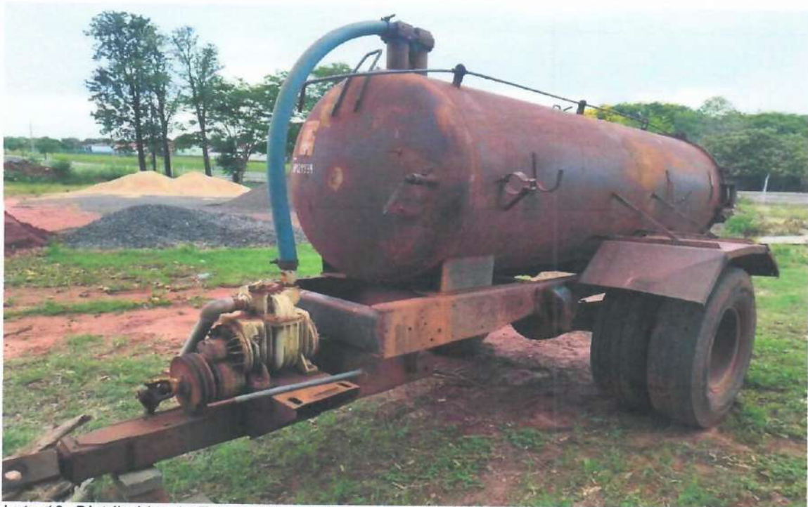
Lote 10- Distribuidor de Esterco Líquido Incomagri 3.500l