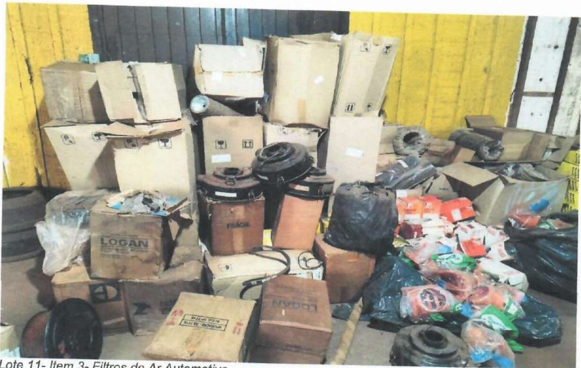
Lote 11- Item 3- Filtros de Ar Automotivo