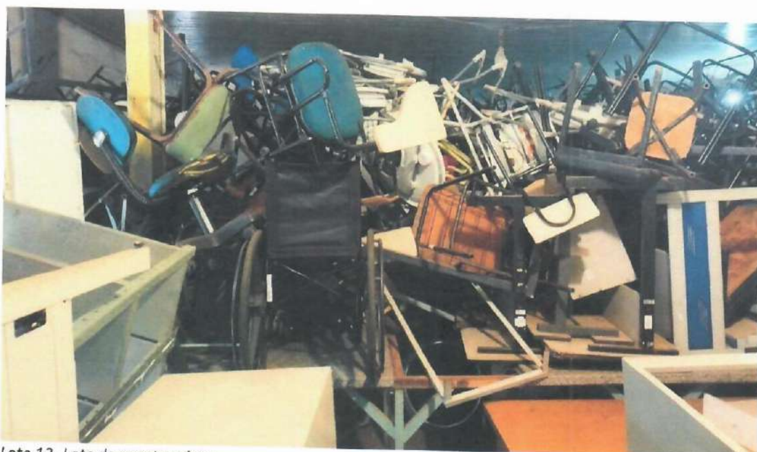
Lote 13- Lote de sucata mista