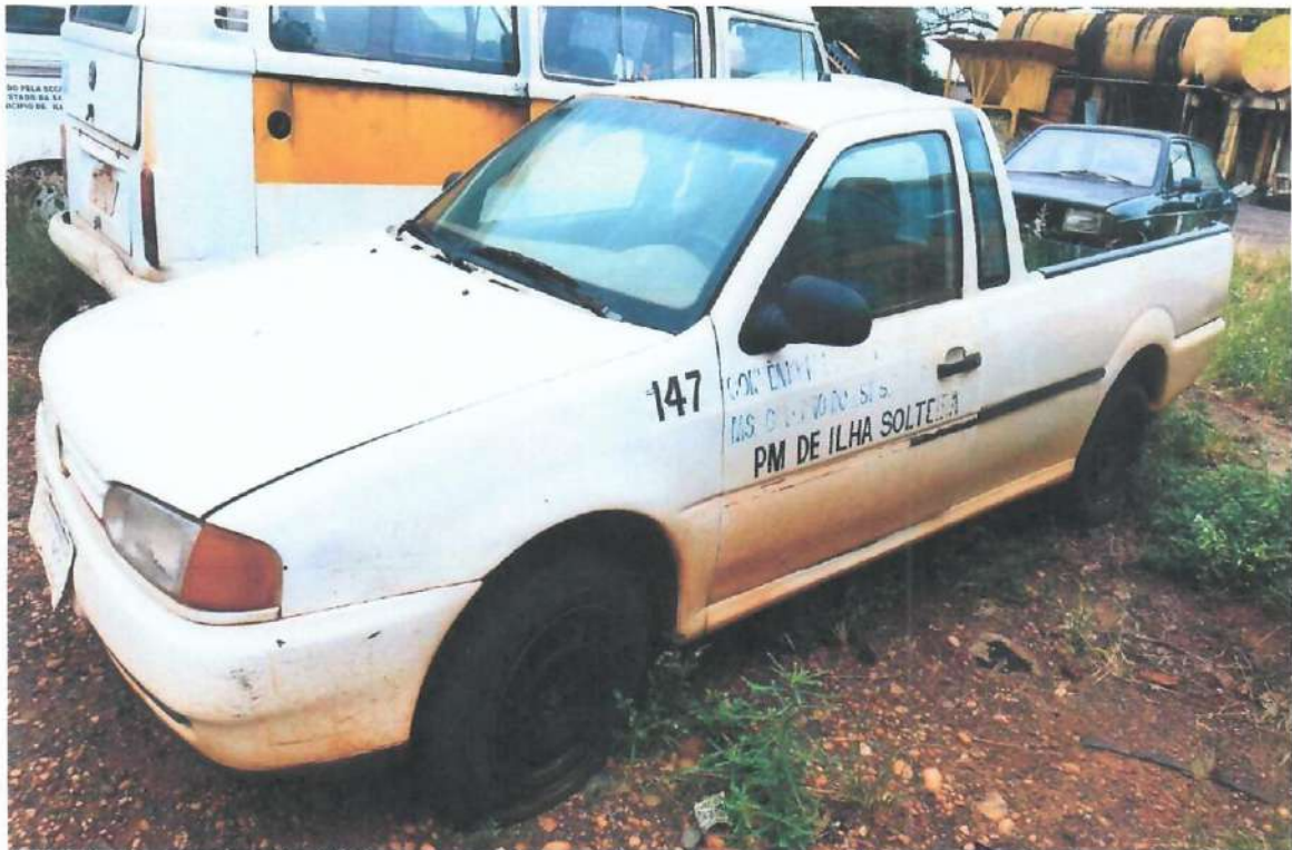
Lote 01- Picape Saveiro VW