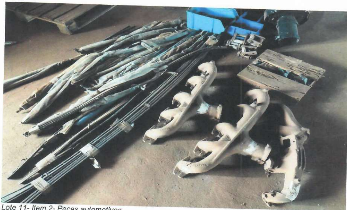
Lote 11- Item 2- Peças automotivas