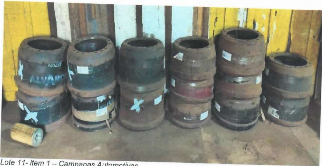
Lote 11- item 1 – Campanas Automotivas