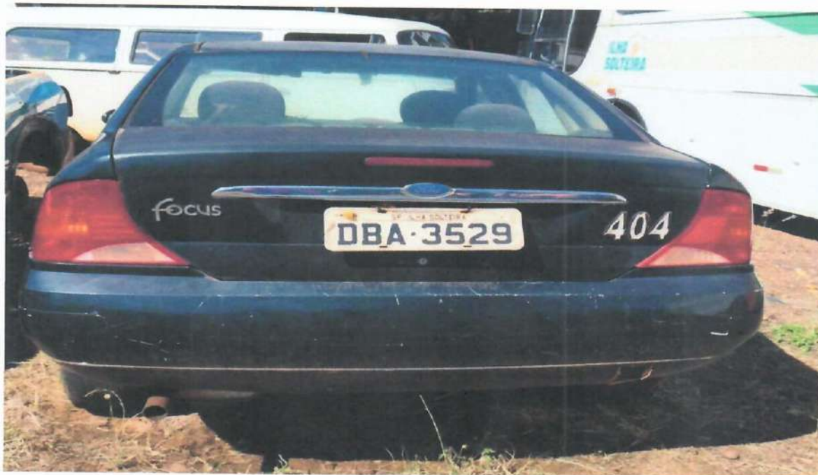
Lote 09- Ford Focus 2.0