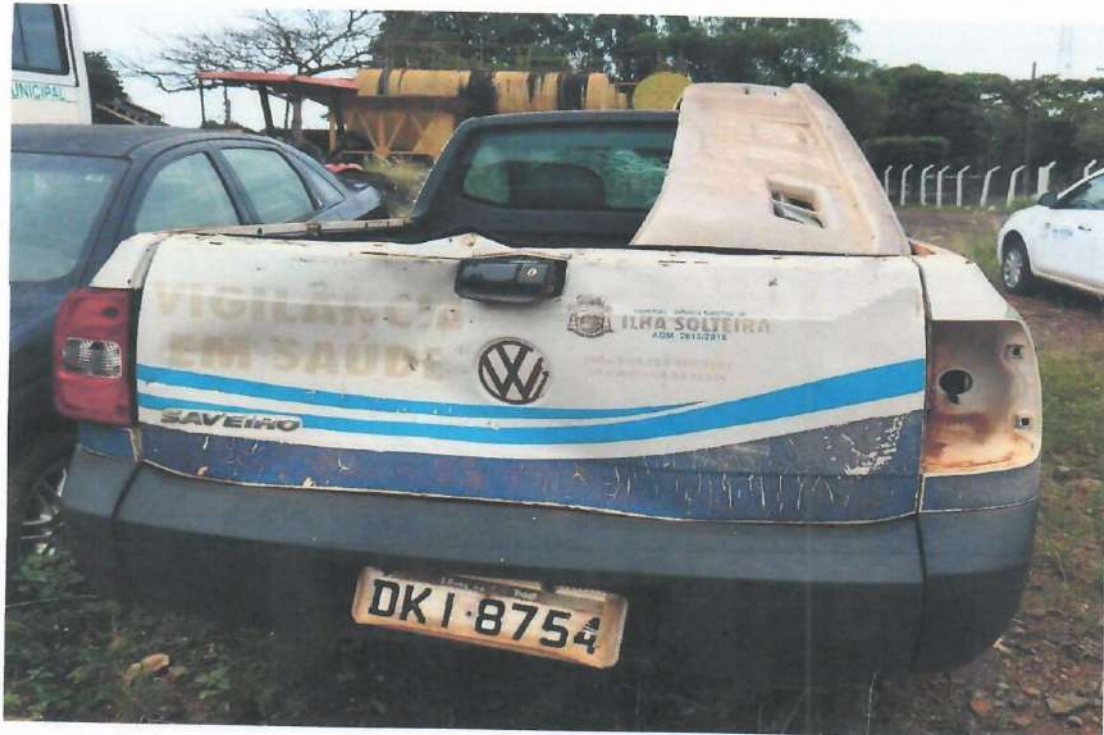
Lote 08- Item 1- Picape Saveiro CS