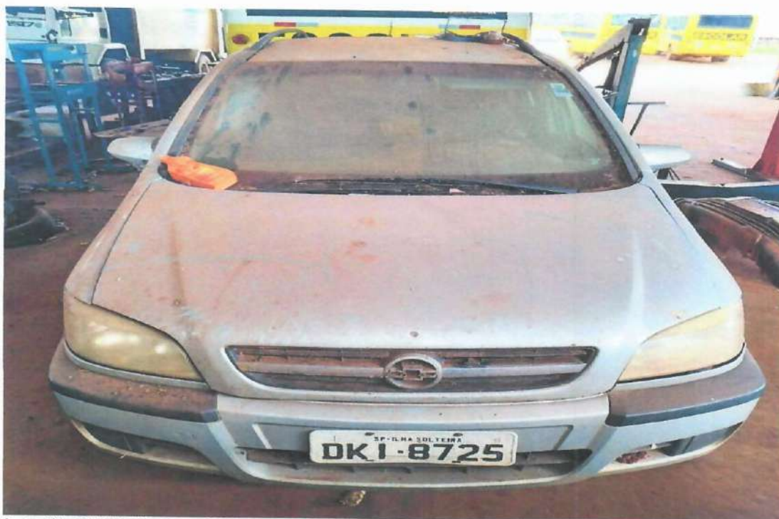
Lote 07- GM Zafira Comfort 2.0