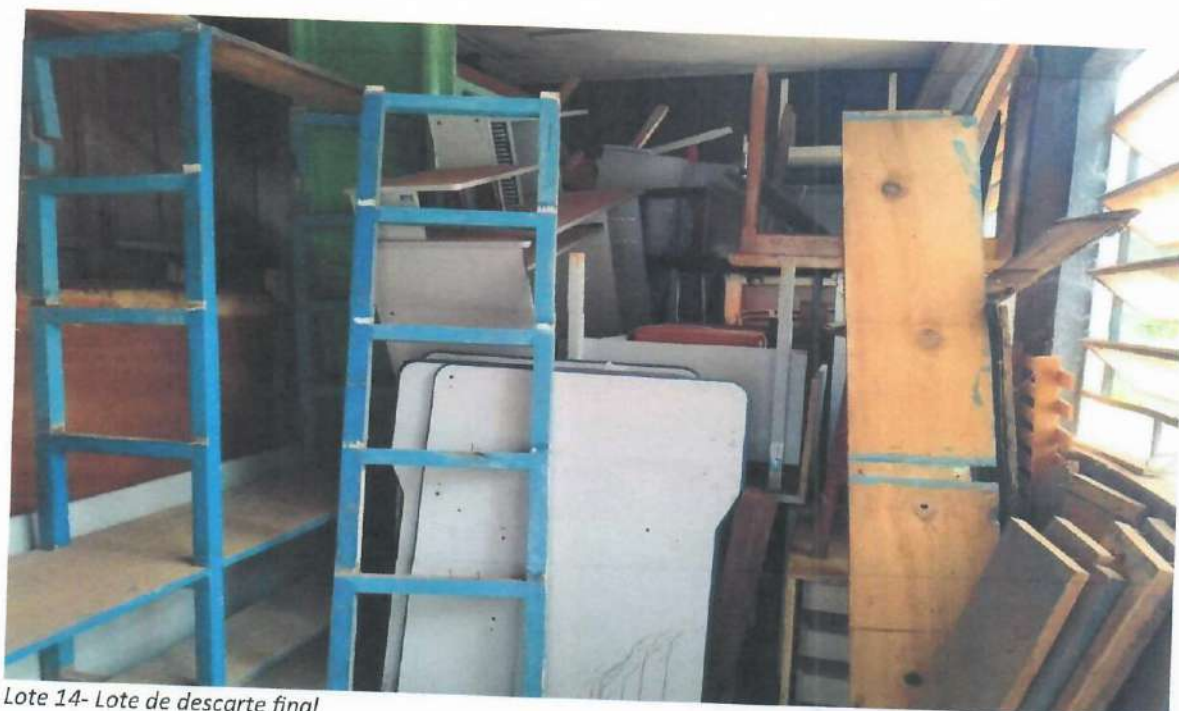
Lote 14- Lote de descarte final