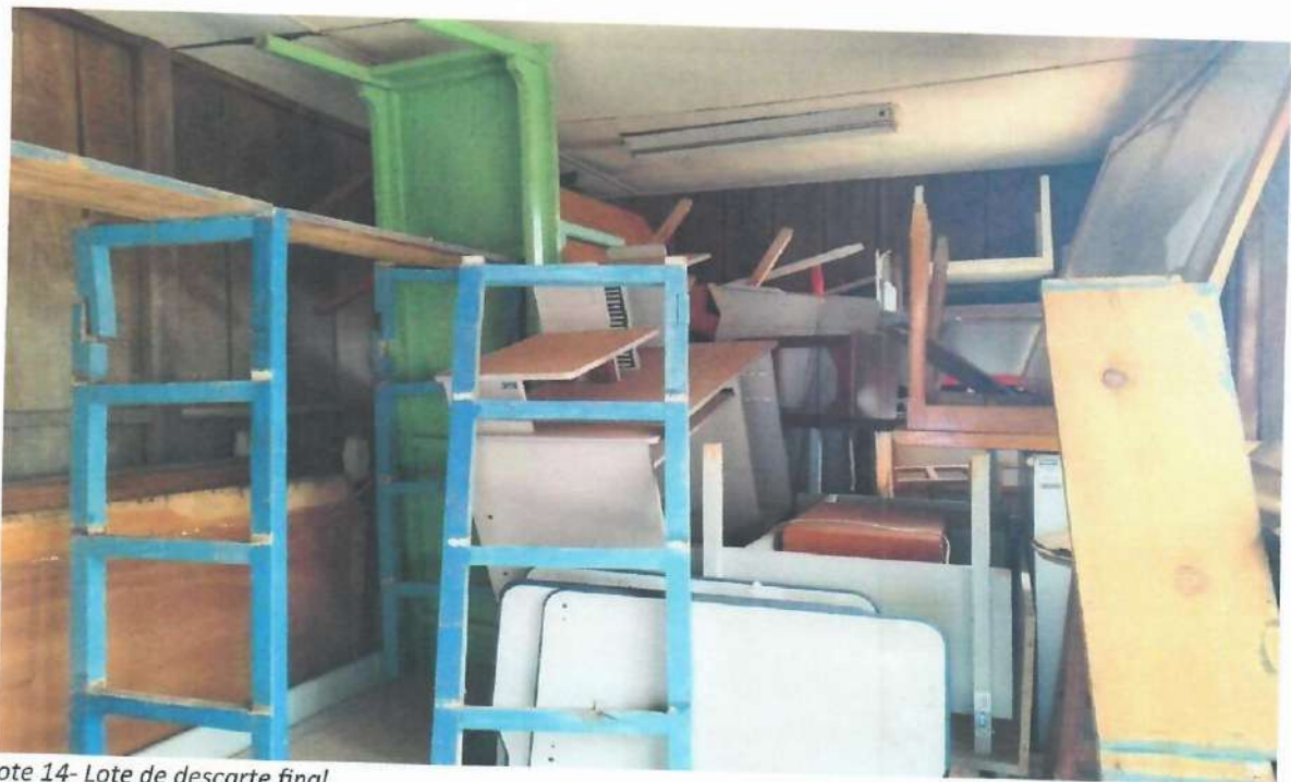
Lote 14- Lote de descarte final