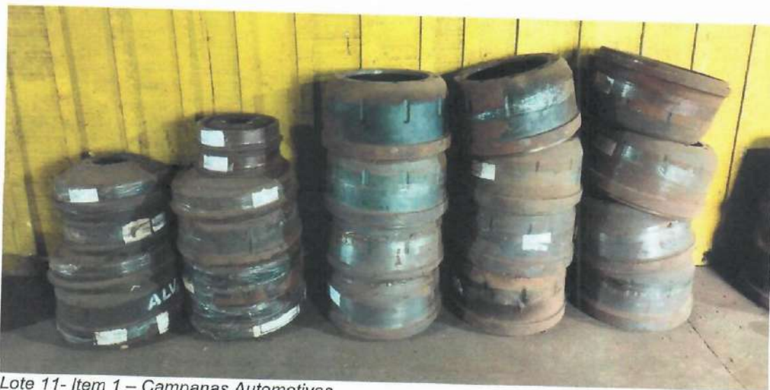
Lote 11- Item 1 – Campanas Automotivas