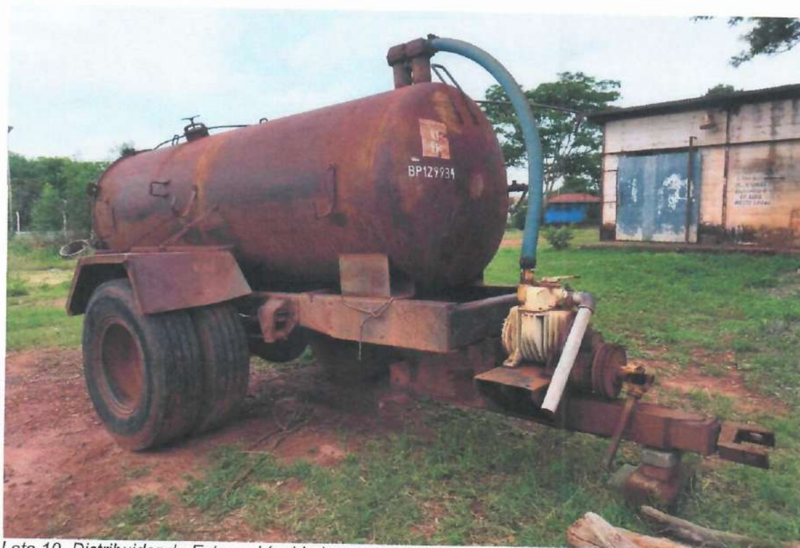
Lote 10- Distribuidor de Esterco Líquido Incomagri 3.500l