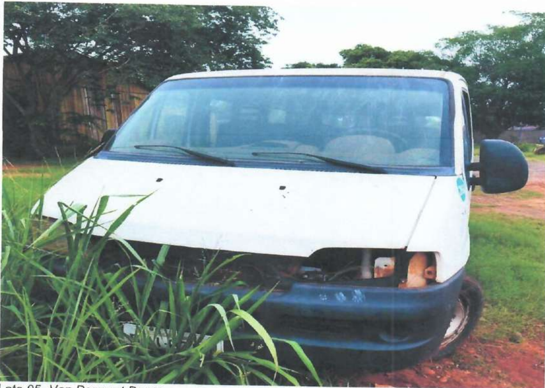
Lote 05- Van Peugeot Boxer