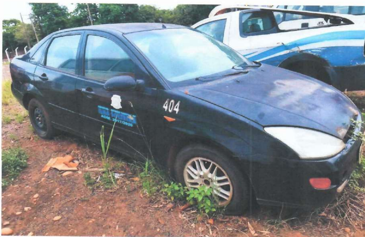
Lote 09- Ford Focus 2.0