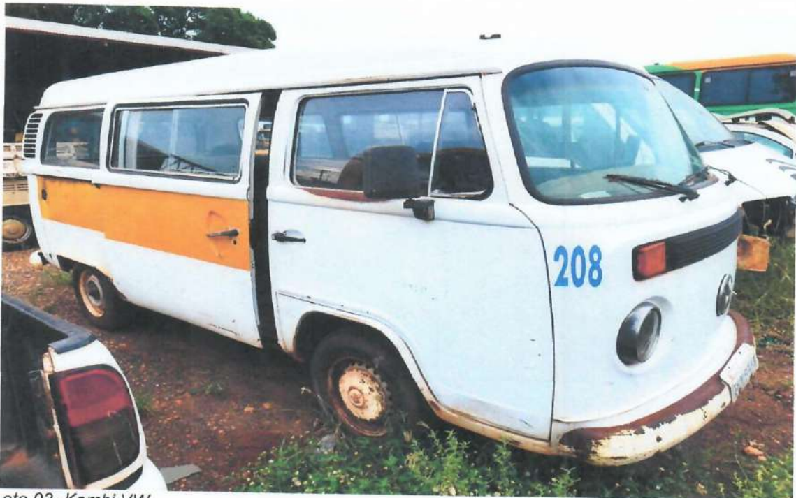
Lote 03- Kombi VW