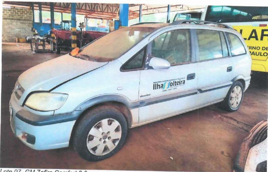
Lote 07- GM Zafira Comfort 2.0