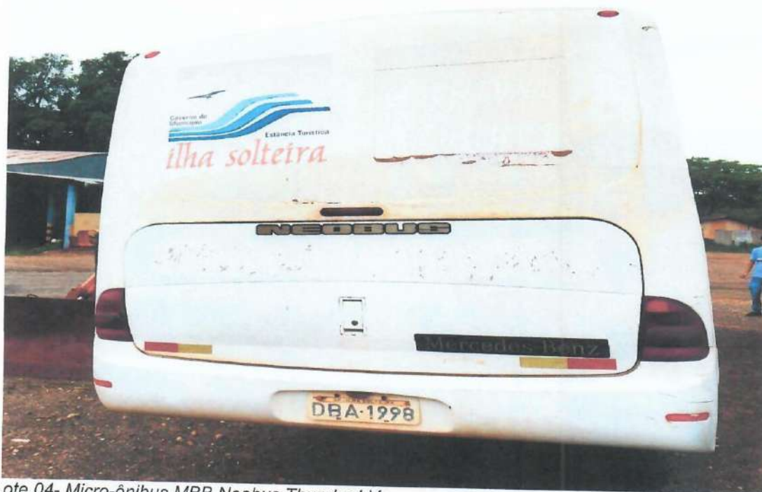
Lote 04- Micro-ônibus MBB Neobus Thunder LV